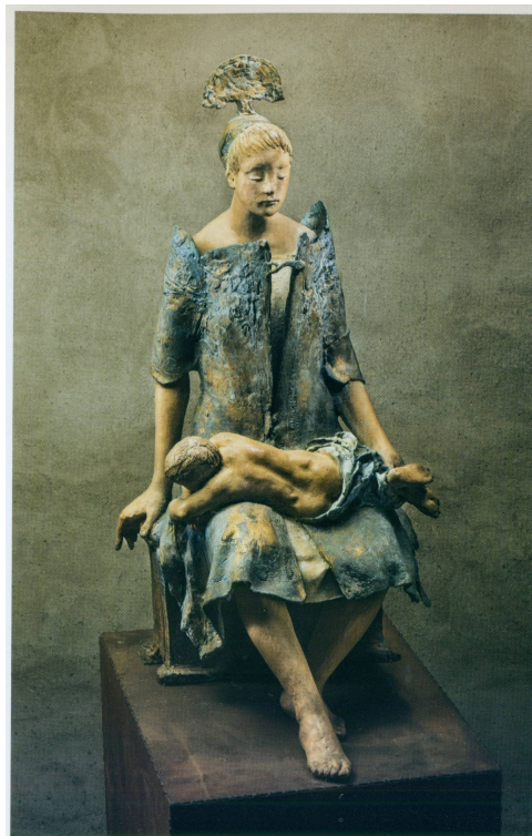
Grande Madre di Piero, 1998