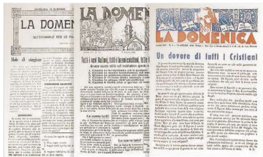
L'evoluzione de «La Domenica» in alcuni numeri usciti tra le due guerre.